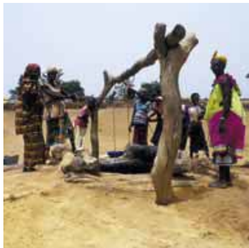
Wasserrückhaltebecken für Zusatzbewässerung und zur Infiltrationsförderung

Im Zentrum steht die Erhöhung der Effizienz sowie die lokale Verantwortung und Kontrolle des Managements der Systeme. Zur Steigerung der Produktivität pro Wassereinheit verfolgt die DEZA die Strategie des «more crop and jobs per drop». Sie engagiert sich hauptsächlich in Halbtrocken- und Trockengebieten, wo sie Regenfeldbau-Systeme sowie den Schutz und die Erhaltung des Feuchtigkeitshaushaltes im Boden fördert. Dies umfasst auch kleinflächige Bewässerung mit lokal angepassten, nachfrageorientierten Methoden, welche für Kleinbauern erschwinglich und im gesamten «Livelihood-System» integriert sind. Sie fördert ebenso entsprechende innovative Ansätze in der Agrarforschung und setzt sich für die Bildung, Ausbildung und Stärkung von Wassernutzervereinigungen ein.